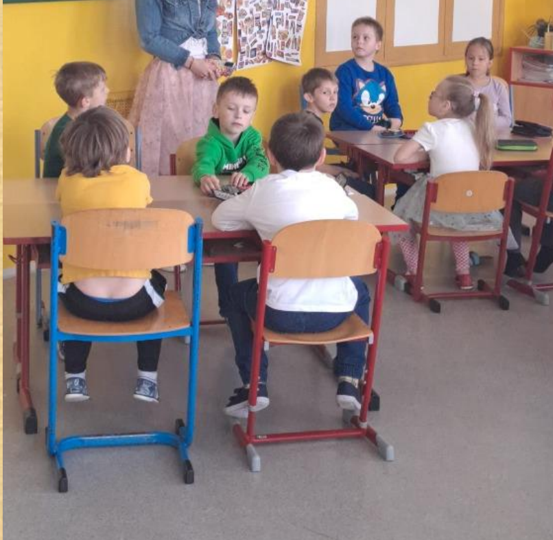
03. dubna 2024 8:57 dop.