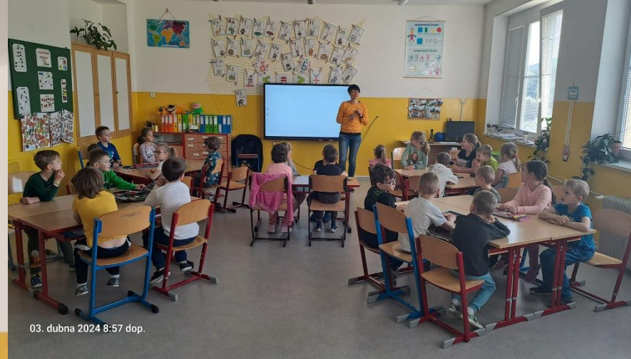
03. dubna 2024 8:57 dop.