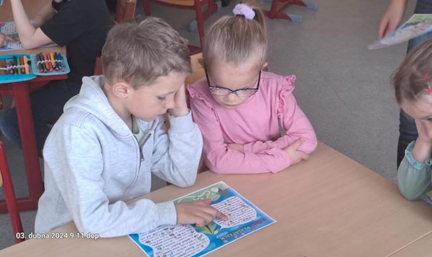
03. dubna 2024 9:11 dop.